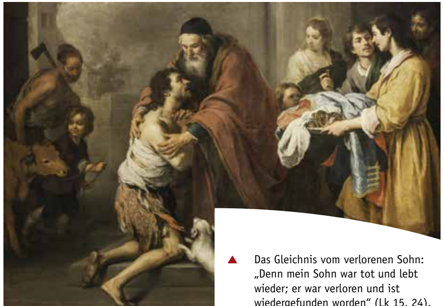
▲ Das Gleichnis vom verlorenen Sohn: „Denn mein Sohn war tot und lebt wieder; er war verloren und ist wiedergefunden worden“ (Lk 15, 24).

Gleichzeitig überwindet die Haltung Jesu einen pharisäischen Legalismus, der den Menschen und das eigentliche Anliegen Gottes aus dem Blick verliert: „Es ist wahr, dass die allgemeinen Normen ein Gut darstellen, das man niemals außer Acht lassen oder vernachlässigen darf, doch in ihren Formulierungen können sie unmöglich alle Sondersituationen umfassen. Zugleich muss gesagt werden, dass genau aus diesem Grund das, was Teil einer praktischen Unterscheidung angesichts einer Sondersituation ist, nicht in den Rang einer Norm