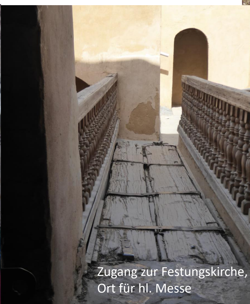
Zugang zur Festungskirche, Ort für hl. Messe