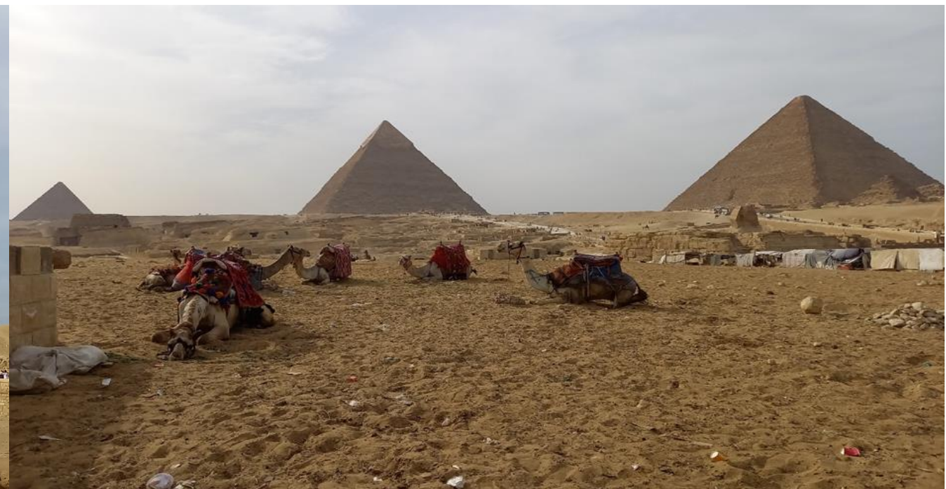
Gizeh: Cheops-, Chephren- und Mykerinos-Pyramide