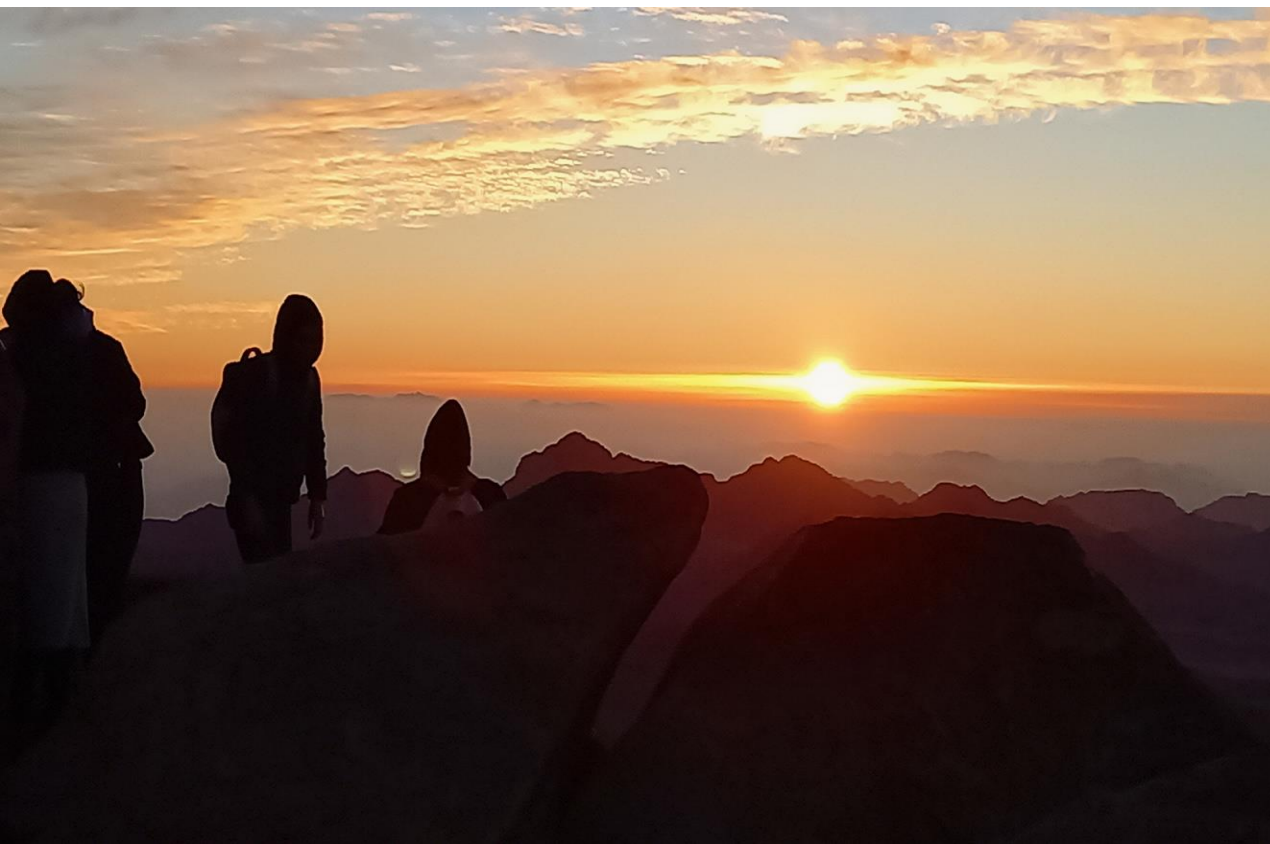
Berg Mose bei Sonnenaufgang